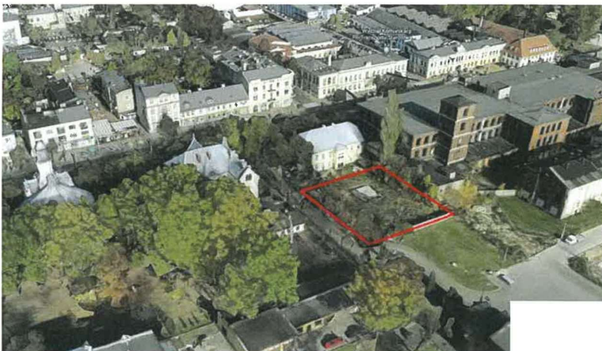
Zdjęcie nr 1 – Zdjęcie lotnicze wykonane na podstawie portalu google earth – widok terenu inwestycji od strony południowo-wschodniej (teren działki nr ewid. 5/2 oznaczono linią czerwoną)

Nr księgi wieczystej nieruchomości głównej, na której planuje się budowę budynku objętej wnioskiem: LD1P/00044331/6