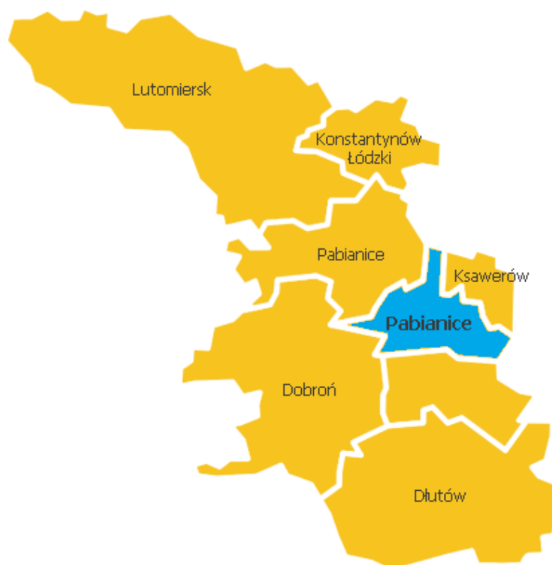
Rysunek 1. Miasto Pabianice w powiecie pabianickim

Miasto zajmuje obszar 33 km 2 . Według danych GUS z 2017 roku Miasto liczy 65 823 mieszkańców, a gęstość zaludnienia to w przybliżeniu 1 995 osób/km 2 . Miasto Pabianice sąsiaduje z następującymi gminami: Łódź, Pabianice (gmina wiejska), Dobroń, Rzgów.